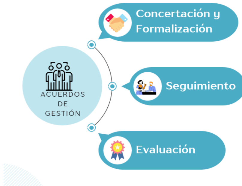
Metodología de acuerdos de gestión - DAFP

En la Unidad Administrativa Especial de Catastro Distrital se adoptó la metodología para acuerdos de gestión del Departamento Administrativo de Función Pública. Entendiéndose que por medio de esta, se tiene implementado un instrumento por medio del cual se pactan, controlan y evalúan los compromisos entre el Gerente Público y su Superior Jerárquico.