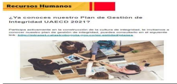
Imagen 5 Capacitación “Plan de Gestión de Integridad”