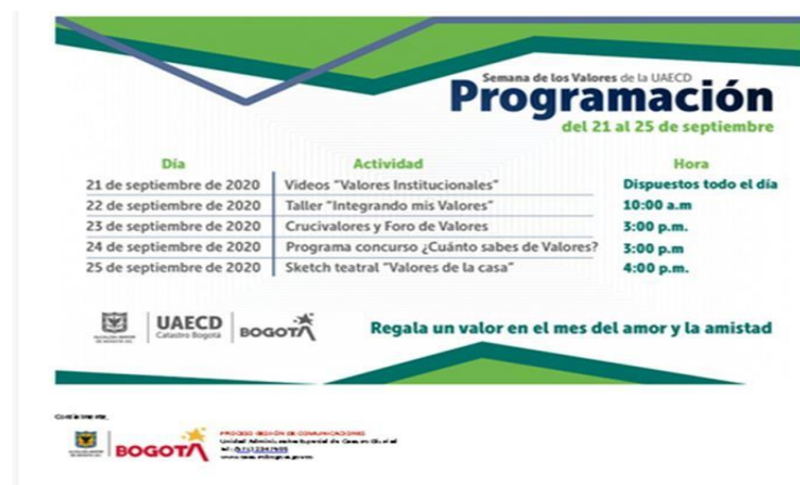
Imagen 1 Semana de valores

En la semana del 21 al 25 de septiembre se observó que se realizó la semana de los valores, con actividades formativas y lúdicas dirigidas al fortalecimiento de la cultura de servicio y los valores del Código de Integridad como se puede ver en la siguiente imagen: