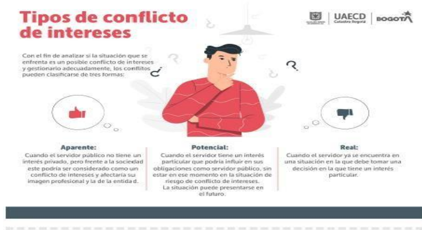
Imagen 4 Capacitación “Conflictos de Interés”