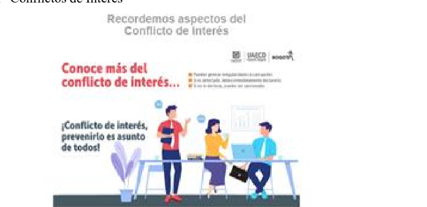
Imagen 3 Capacitación “Conflictos de Interés”

Durante el mes de marzo se encontró que se realizaron diferentes campañas de sensibilización, a través de boletines de comunicaciones, sobre conflicto de interés, orientadas a recordar los aspectos más importantes del tema, los tipos de conflicto de interés, y cuál es el procedimiento para seguir ante una situación de conflicto de interés. Como se puede evidenciar en la siguiente imagen