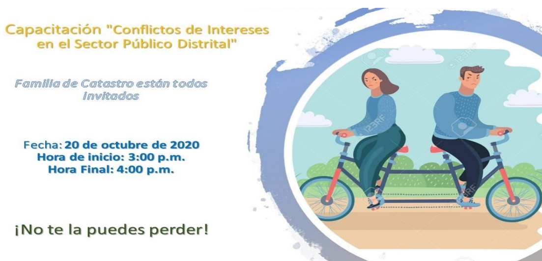
Imagen 2 Capacitación “Conflictos de Interés”

La OCI evidenció que la UAECD realizó una jornada de capacitación sobre conflictos de interés en el sector público distrital, con el apoyo de la Veeduría Distrital, en la que se dio a conocer mediante ejemplos y de manera didáctica las situaciones que pueden generar conflictos de interés, como y en qué momento reportarlo, entre otros aspectos como se puede observar en la siguiente imagen