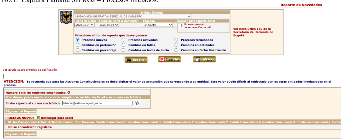
Imagen No.1. Captura Pantalla SIPROJ – Procesos iniciados.