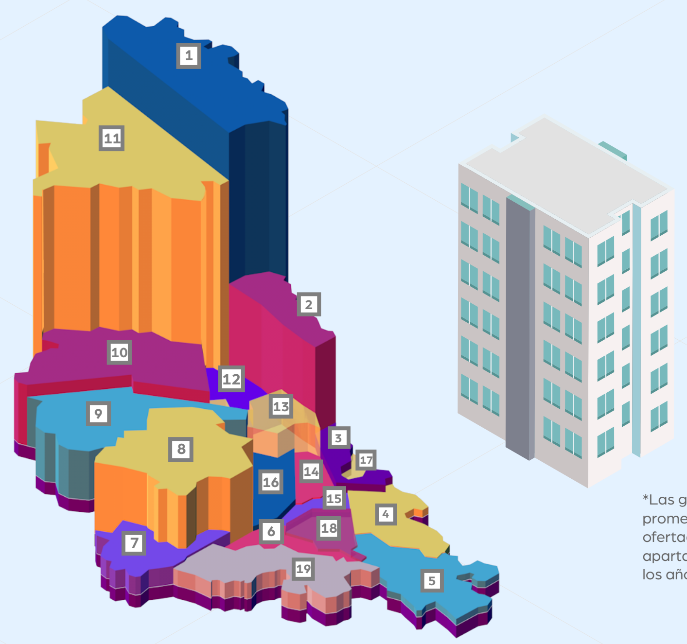
*Las gráficas muestran un promedio de las unidades ofertadas por localidad de apartamentos y casas entre los años 2017 y 2020

Bogotá, como principal centro de la actividad inmobiliaria de la región, presentó durante el cuatrienio 2017 – 2020 un total de oferta de vivienda usada en venta correspondiente a apartamentos y casas de 333.891 unidades.